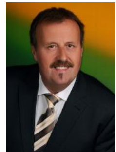
Euer/Ihr Günter Wolf Bürgermeister

Ich darf auch im Vorfeld um Verständnis für diese Maßnahme ersuchen. Wichtig erscheint mir die Sicherheit für unserer GemeindegängerInnen im Straßenverkehr. Die Erhaltung der Wirtshauskultur ist mir ein wichtiges persönliches Anliegen.